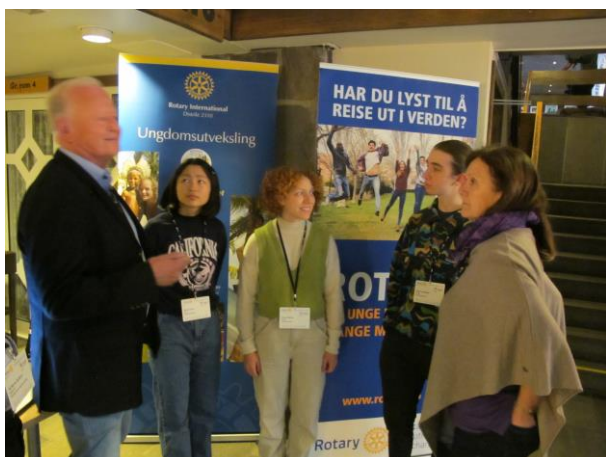
Det ble arrangert "House of Friendship" med god deltakelse og mange stands som ble godt besøkt.