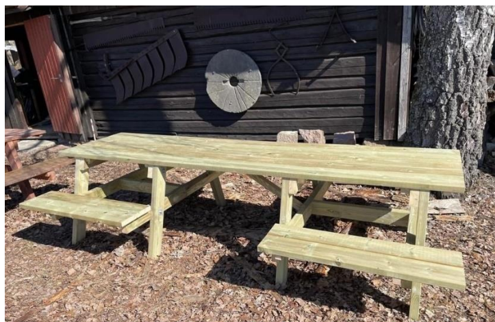
Spesiallagde benker som skal utplasseres av Hurum RK.