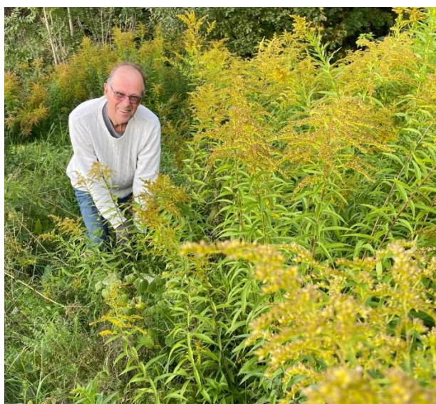
Rydding/luking av den uønskede planten Kanadagullris langs Øverlandsvassdraget som Eiksmarka Rotaryklubb gjør i samarbeide med Bærum Elveforum og Bærum kommune.