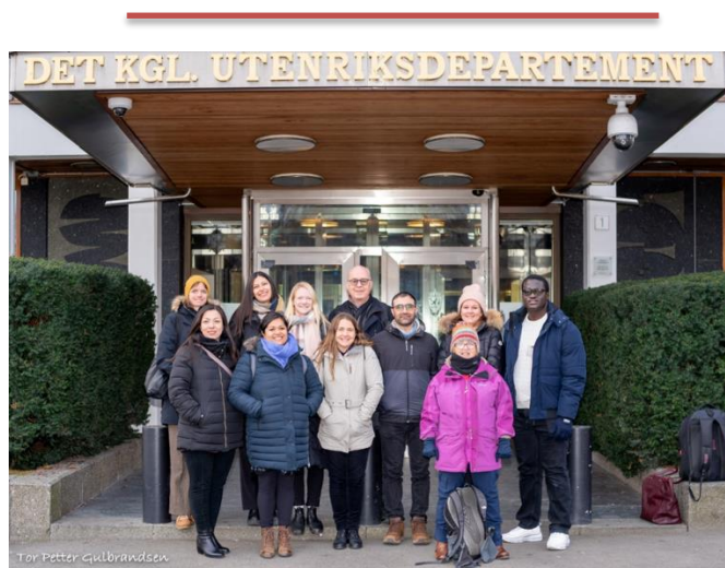
Fredsstudentene på besøk.

Over sommeren skal klubbene delta i gjennomføringen av Summer Camp, den første i vårt Distrikt på mange år. Campen gjennomføres som et samarbeidsprosjekt med fire andre klubber i Distriktet. Planleggingen er i rute og man ser frem til å motta et knippe forventningsfulle og motiverte deltakere fra det store utland.