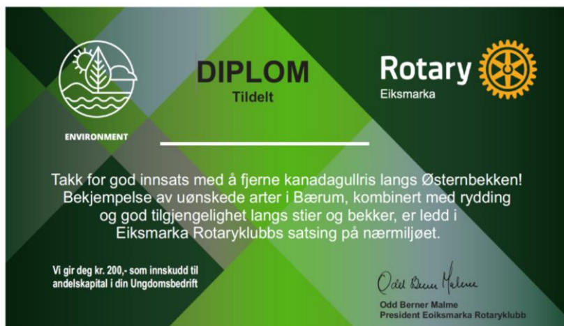
Diplom som deles ut til 42 elever ved Eikli skole som har bidratt med denne ryddingen.