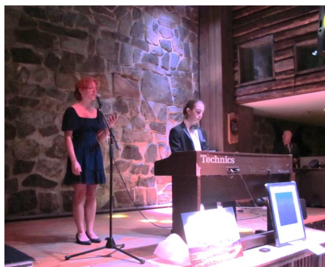
Utvexlingsstudentene bidro med et vakkert musikalsk innslag under aperitiffen