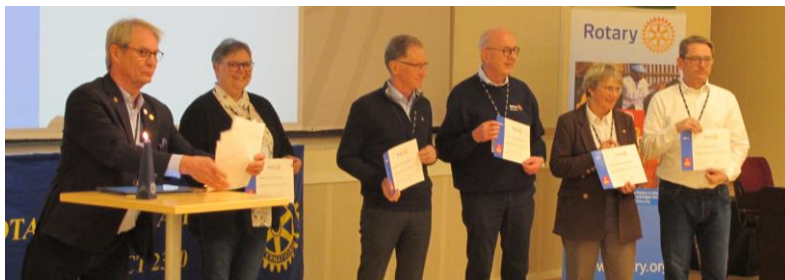
Utdeling av diplomer til klubbene med støst bidrag til TRF og Polio.